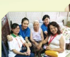
義工探訪老人情況