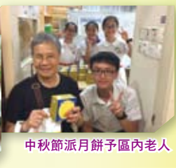
中秋節派月餅予區內老人