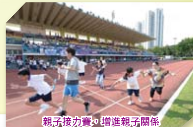
親子接力賽，增進親子關係