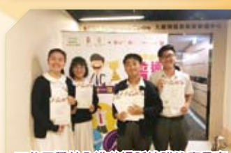
四位同學於全港普通話演講比賽勇奪金銀獎，更獲得最傑出參與學校獎。