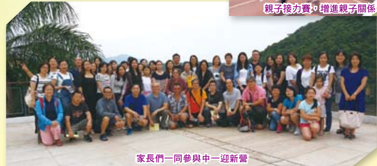
家長們一同參與中一迎新營