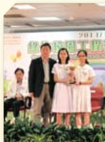
多年獲得綠色校園工程獎