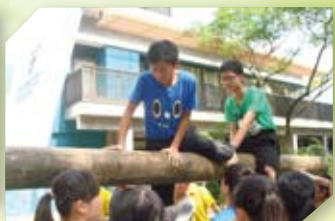
同學參與領袖訓練營