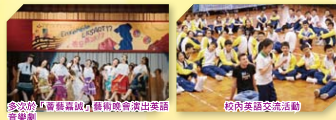
多次於「百藝嘉誠」藝術晚會演出英語音樂劇