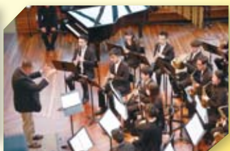
本校管樂團到澳洲交流