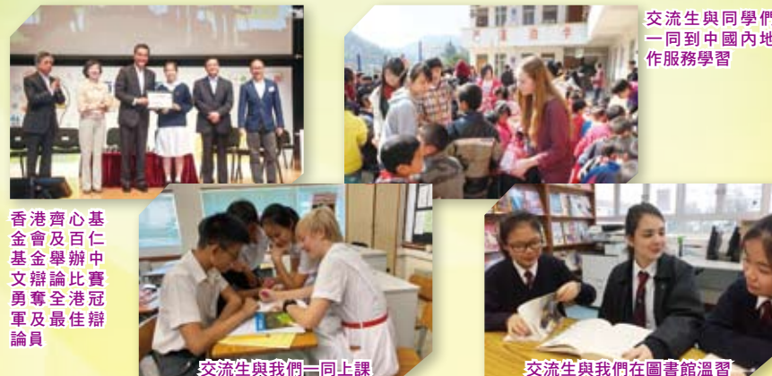
香港齊心基金會及百仁基金舉辦中文辯論比賽勇奪全港冠軍及最佳辯論員