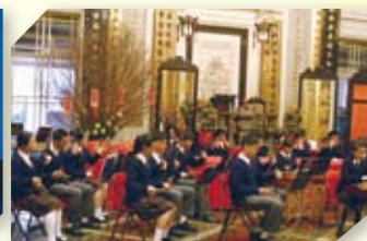
本校中樂團到東華三院參與匯演