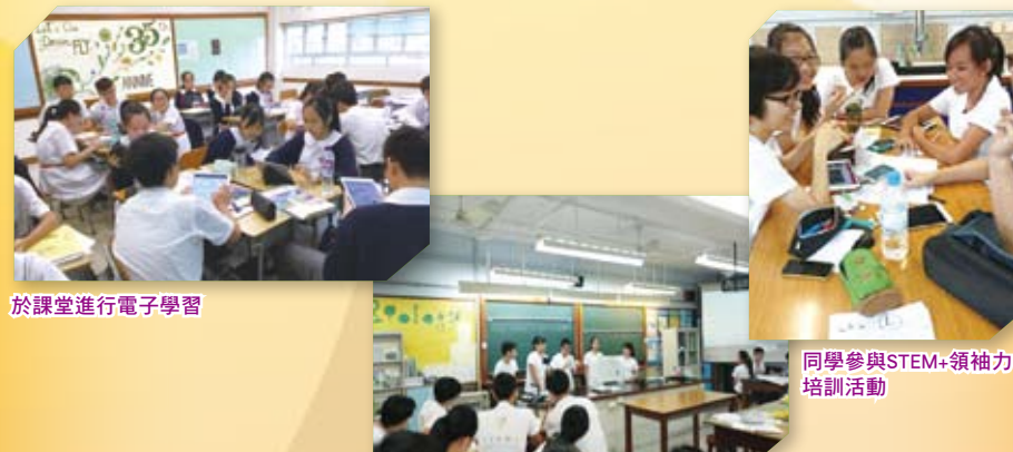
於課堂進行電子學習