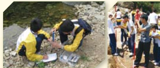
同學在校外進行專題研習