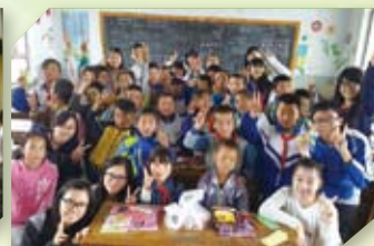
同學到中國內地作山區服務學習