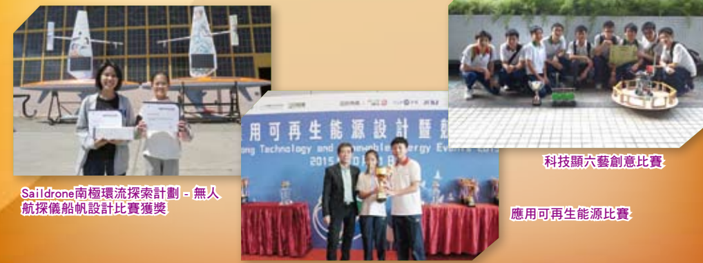
Sailldron南極環流探索計劃 - 無人航探艦船航設計比賽獲獎