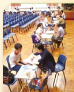
生涯規劃個別輔導