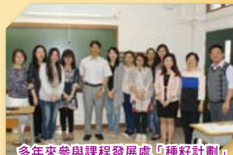
多年來參與課程發展處「種籽計劃」