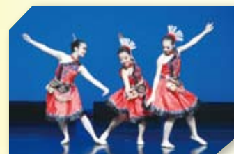
本校中國舞組屢獲獎項